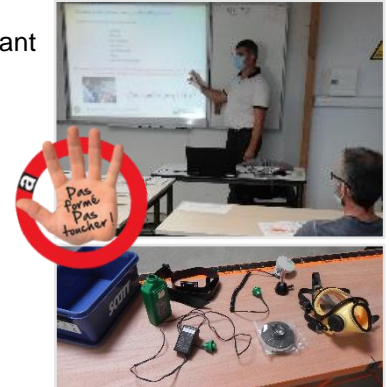
Source photo 1 : Visuel de la campagne "Pas, formé, pas toucher", - © OPHBTP Source photo 2 : BTP CFA VIENNE