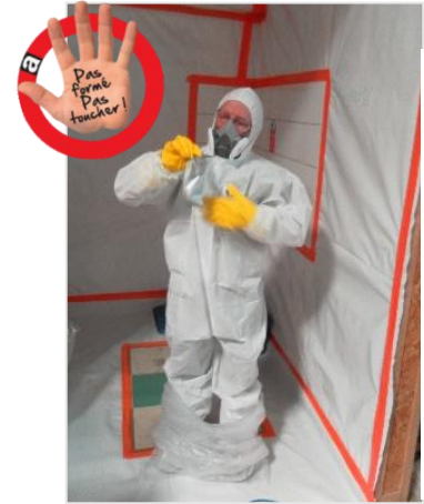
Visuel de la campagne "Pas formé, pas toucher".